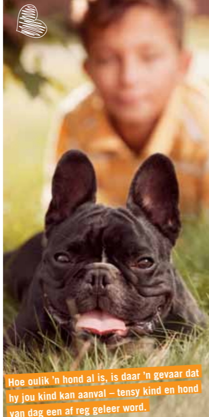
Hoe oulik 'n hond al is, is daar 'n gevaar dat hy jou kind kan aanval – tensy kind en hond van dag een af reg geleer word.

Sy het die middag nog bo-op die hond geklim. Ek was gelukkig in die vertrek. Drie gebreekte vingers en sewe steke later het ons die hond laat uitsit.”